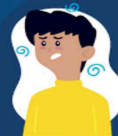
Falta de ar