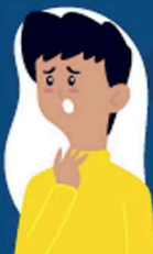
Dificuldade de respirar