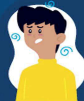
Falta de ar