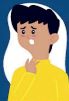
Dificuldade de respirar