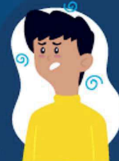
Falta de ar