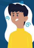
Falta de ar