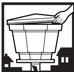
TAMPE OS TONÉIS E CAIXAS-D'ÁGUA.