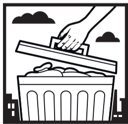
MANTENHA A LIXEIRA BEM FECHADA.