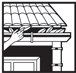
MANTENHA AS CALHAS SEMPRE LIMPAS.