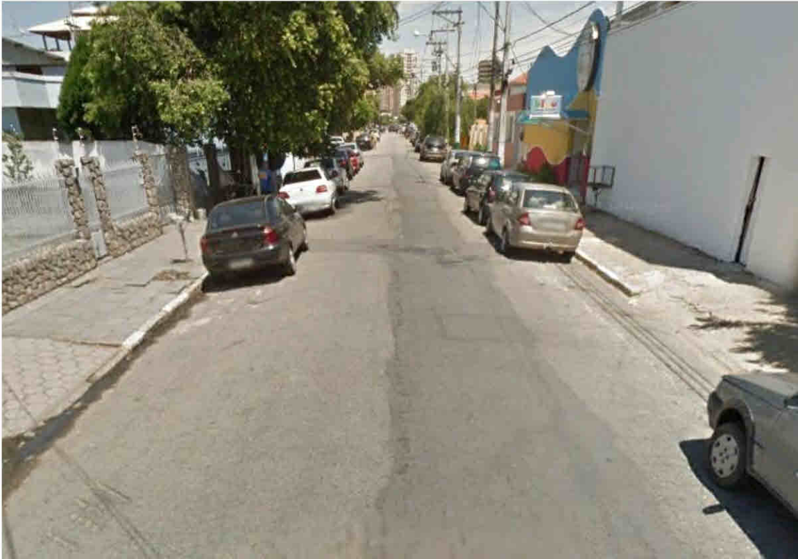
Rua André Luiz – Jardim Carioca