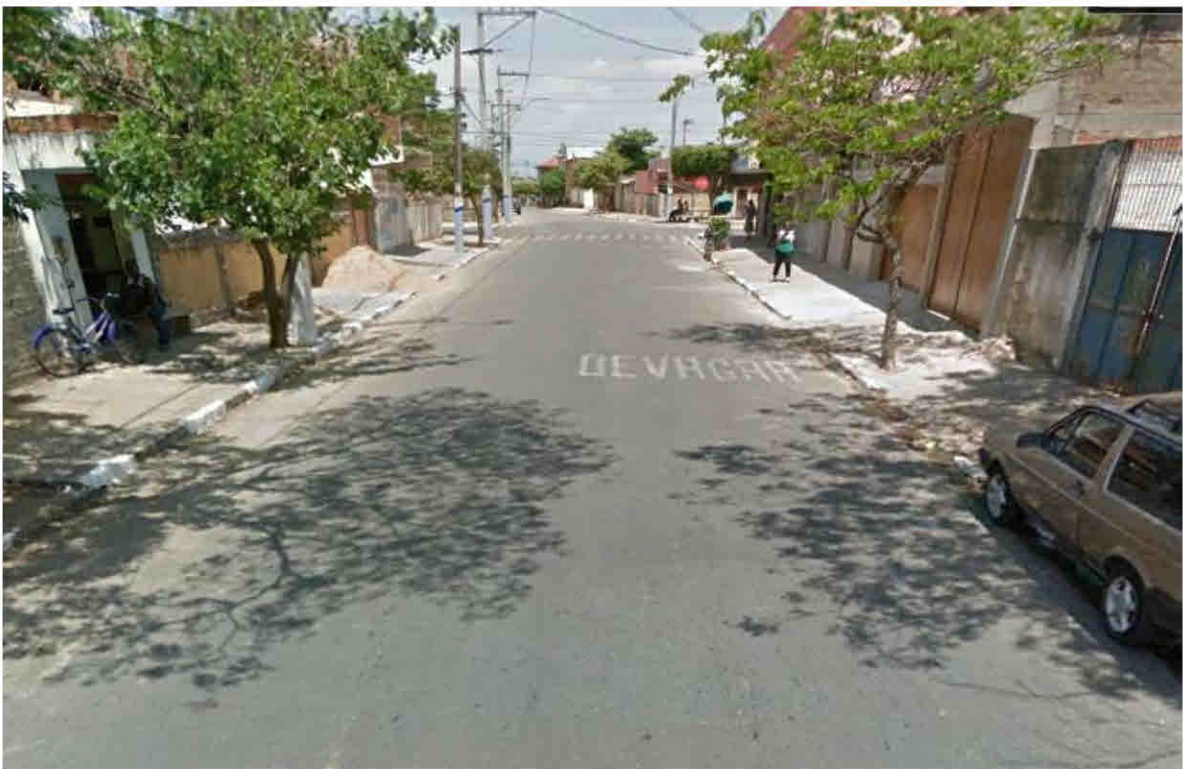
Rua Itaboráí – Parque Guarus