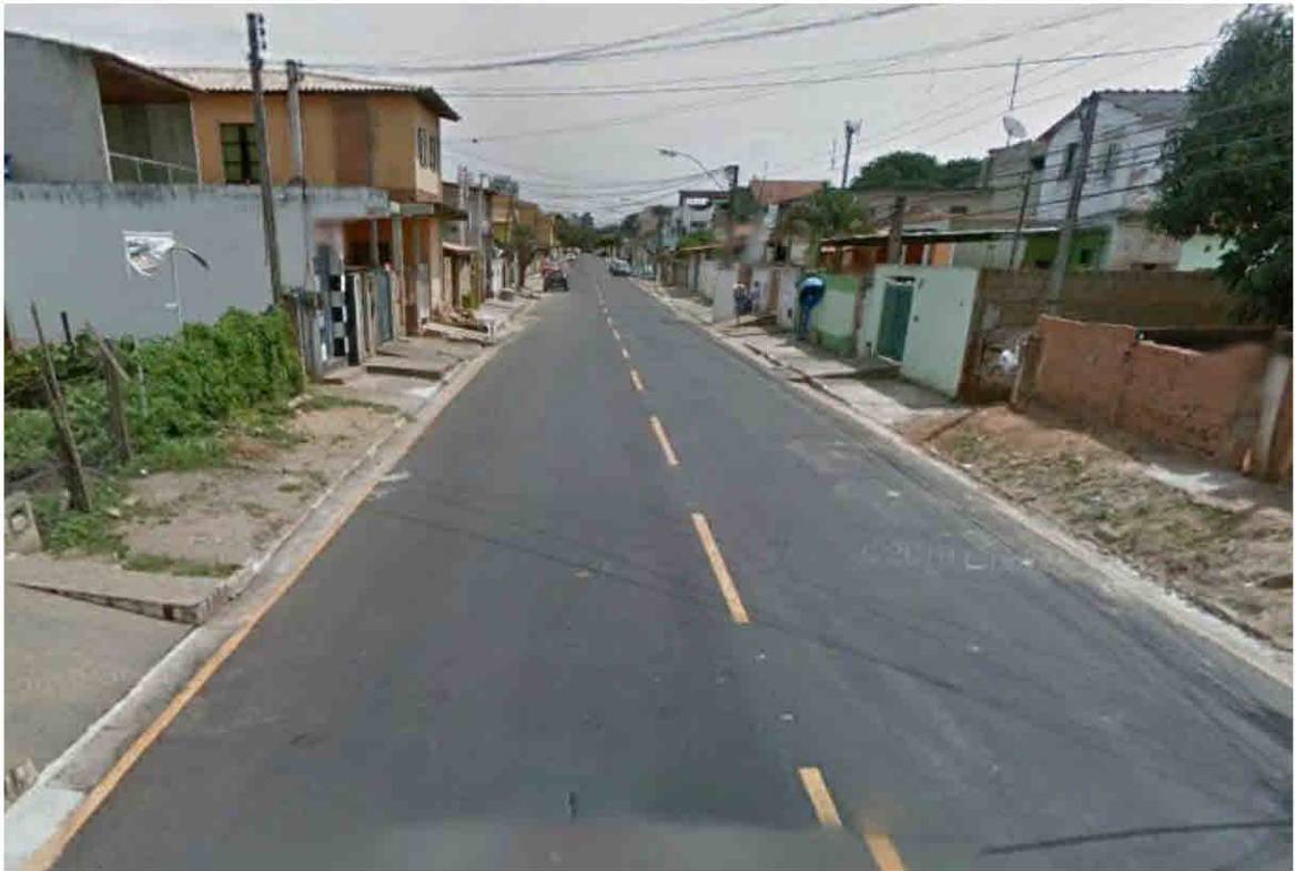
Rua Humberto de Campos – Parque Santo Antônio