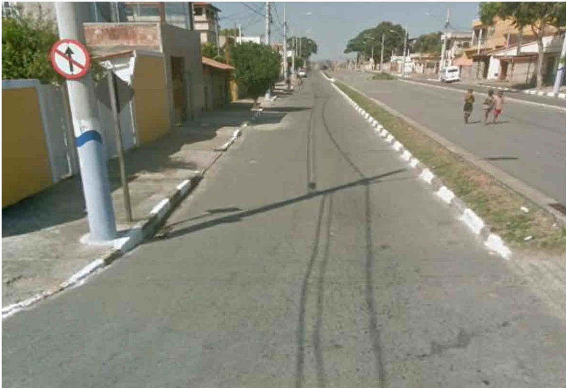
Rua General Esilac Leal – Parque Vera Cruz