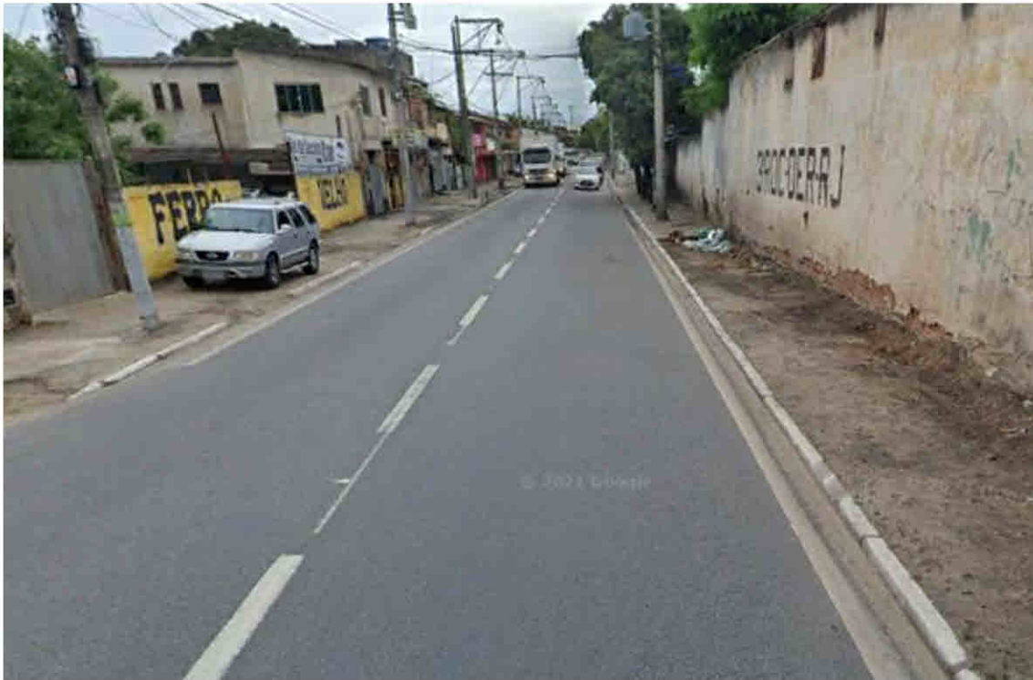
Avenida Souza Mota – Parque Vera Cruz