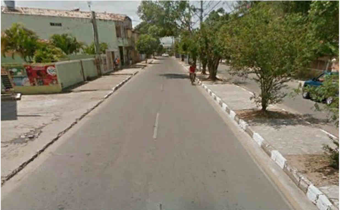
Avenida Petrópolis - Parque Guarus