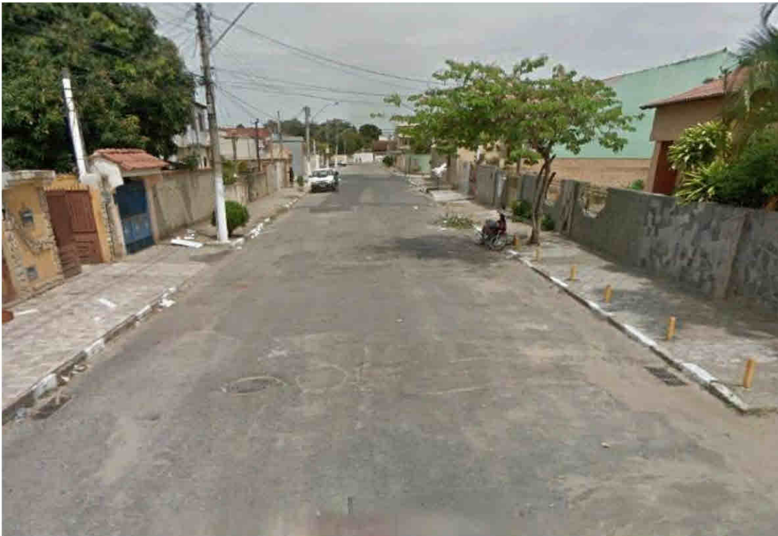
Rua Antônio Aurélio Bessa – Parque Santo Antônio