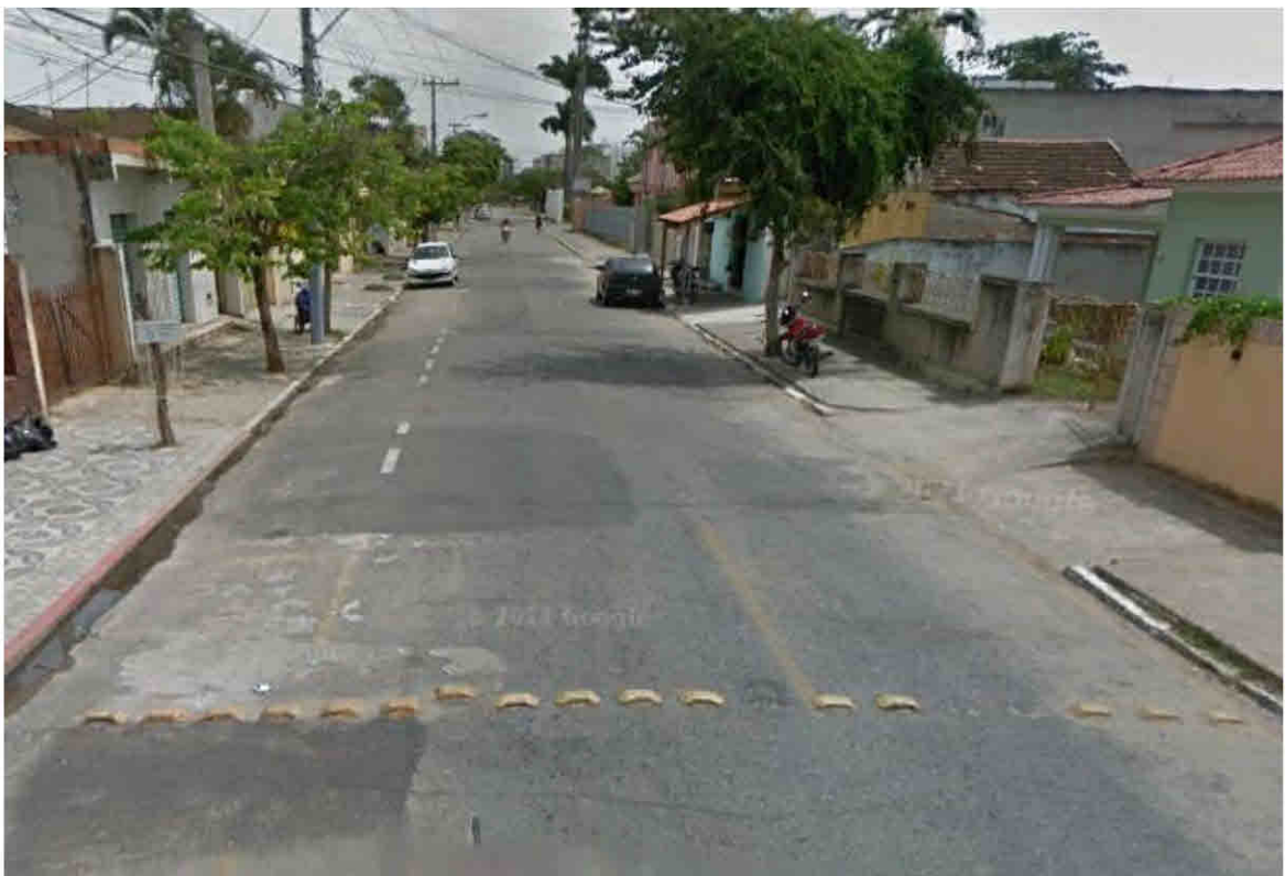
Rua Santo Antônio – Parque Santo Antônio