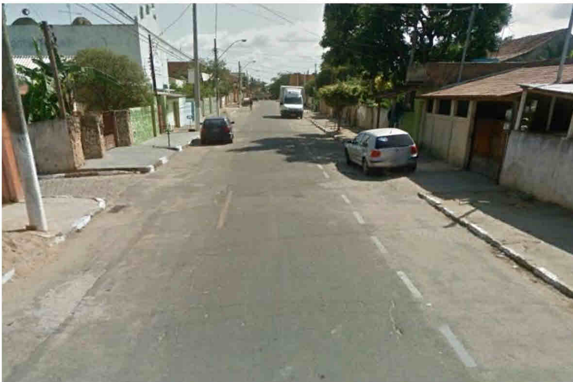
Rua Capitão Henrique Martins – Parque Vera Cruz