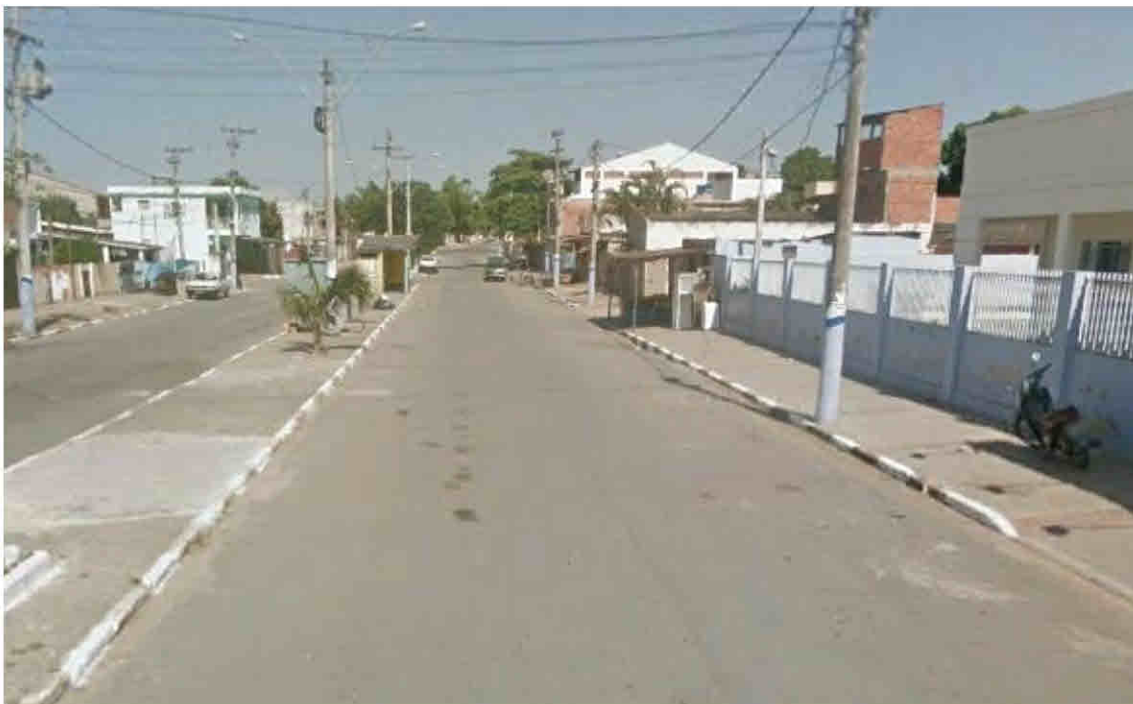
Rua Aldenor Alves dos Santos – Parque Santa Helena