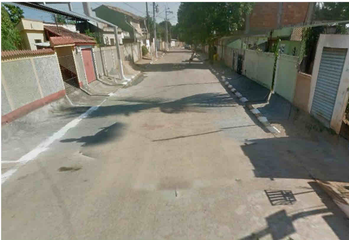
Rua Vinte e Quatro de Fevereiro - Parque Cidade Luz