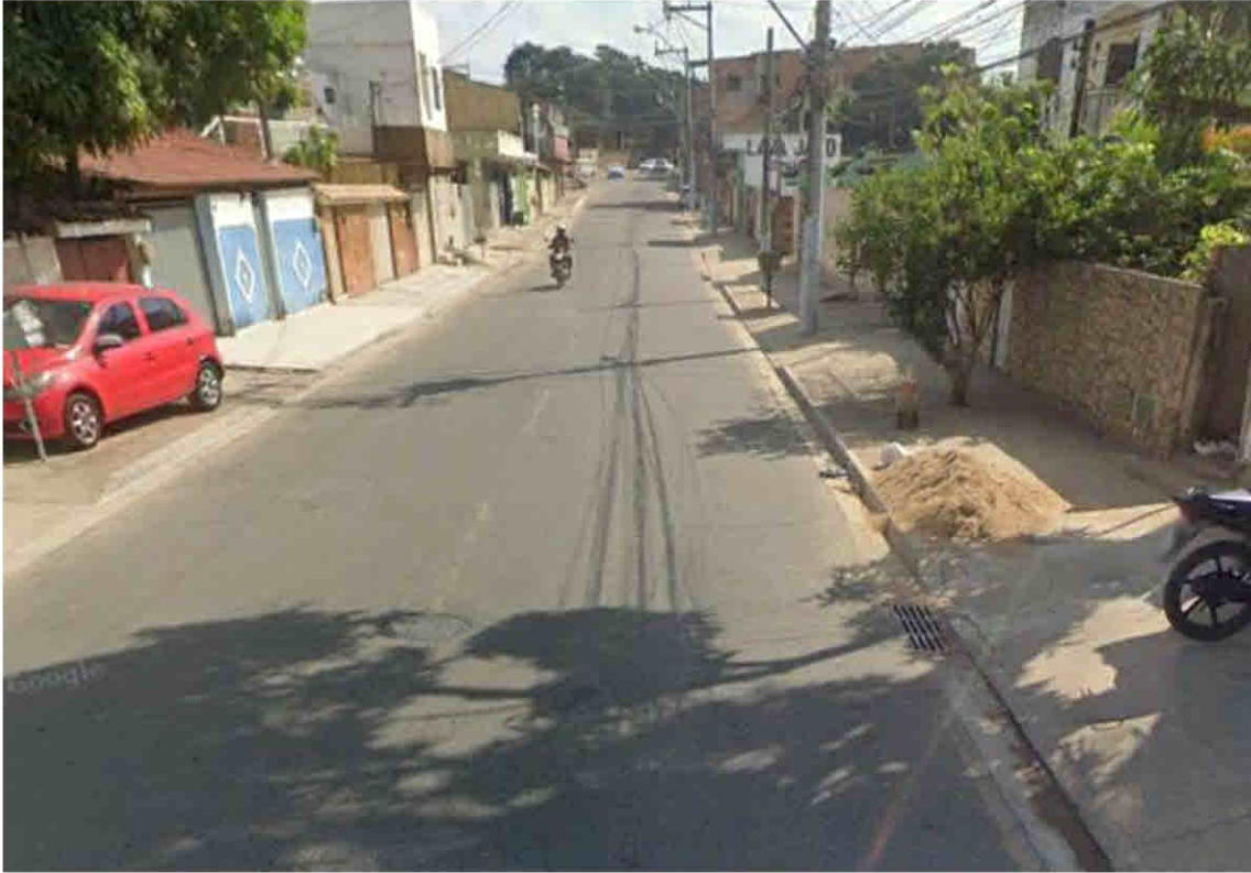
Rua Boa Esperança – Parque Santa Helena