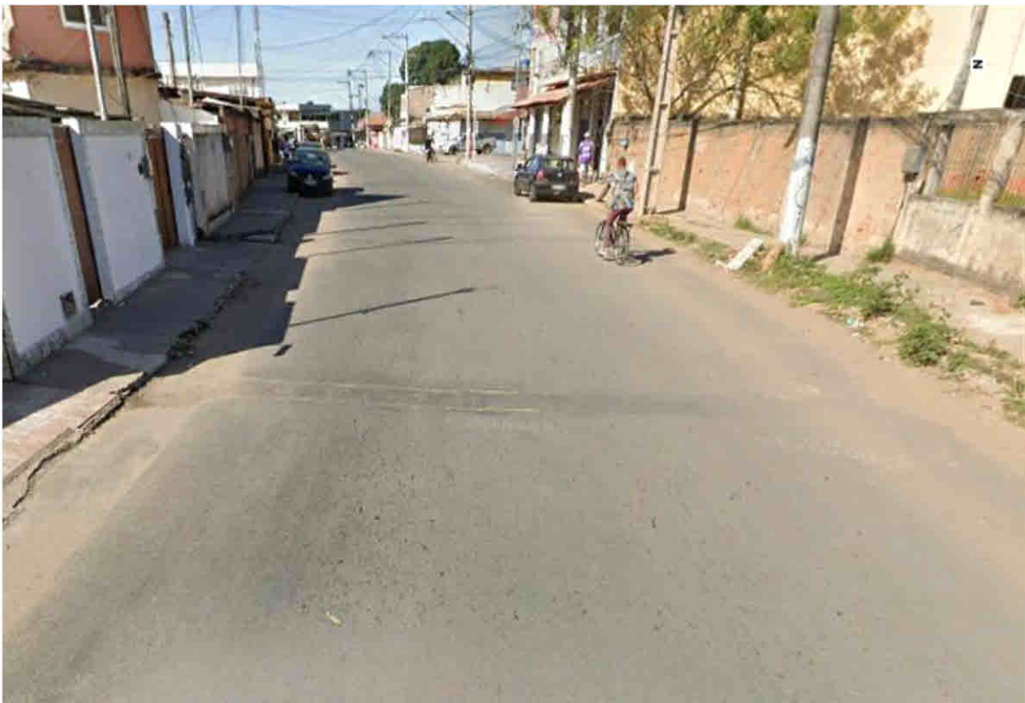
Avenida Rio Grande do Sul - Parque São José