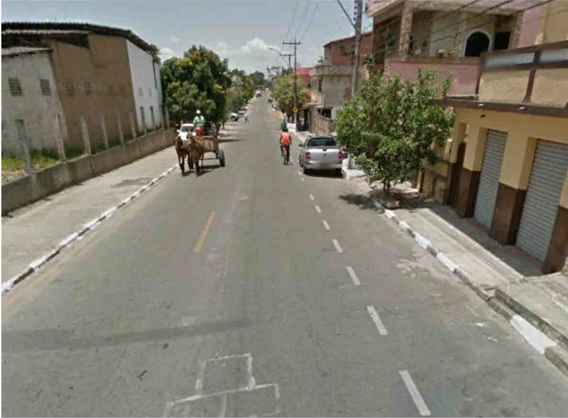
Rua Itaperuna - Parque Guarus