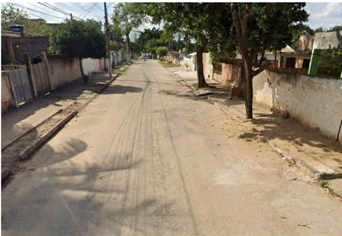
Rua Vinte de Janeiro - Parque Cidade Luz