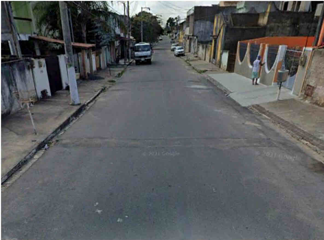
Rua Ceará - Parque São José