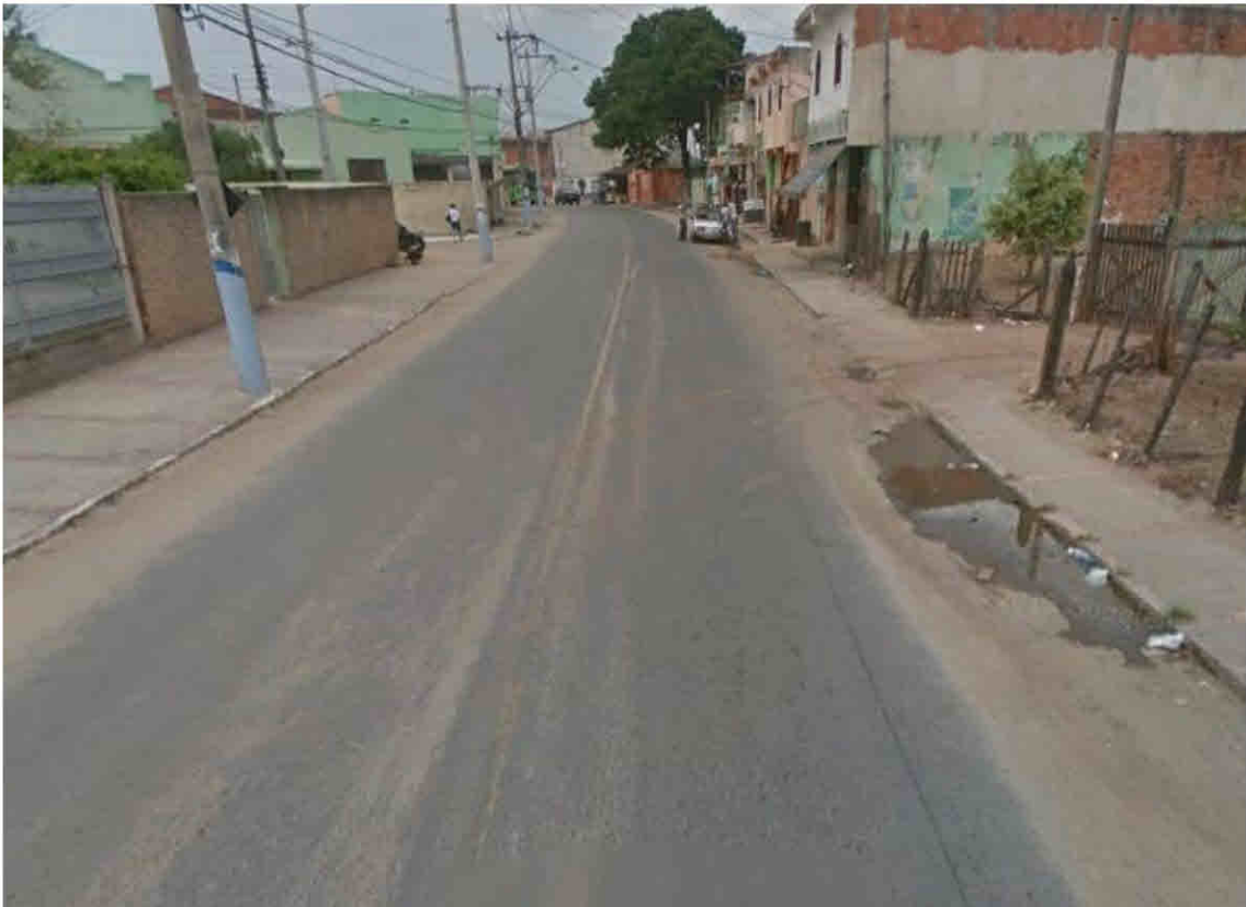
Rua Manoel Luiz Braga - Parque Fundão