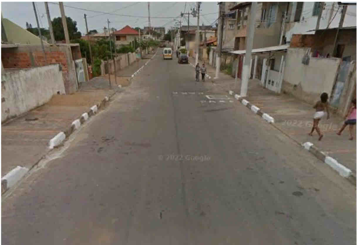
Rua João Fulchi – Parque São Mateus