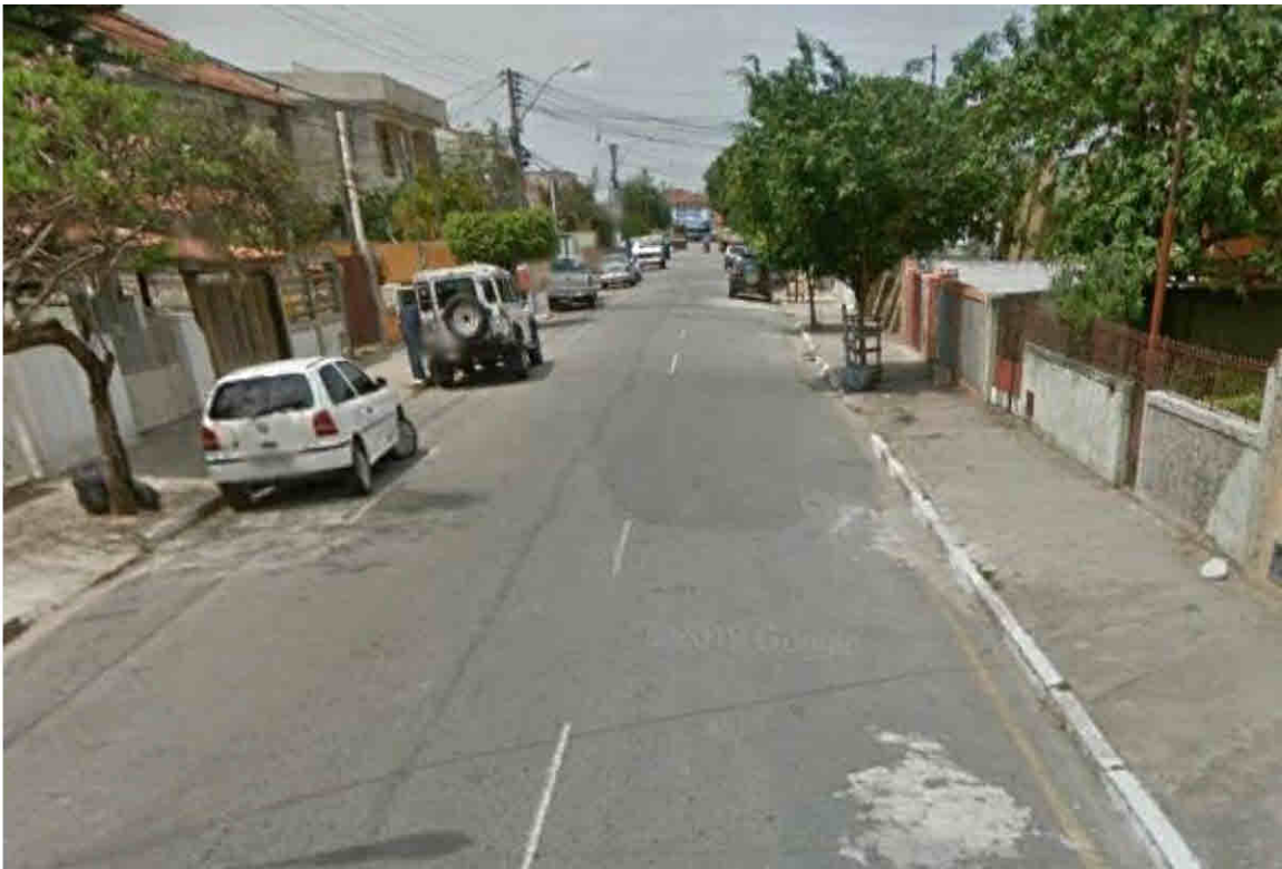
Rua João Alberto – Jardim Carioca