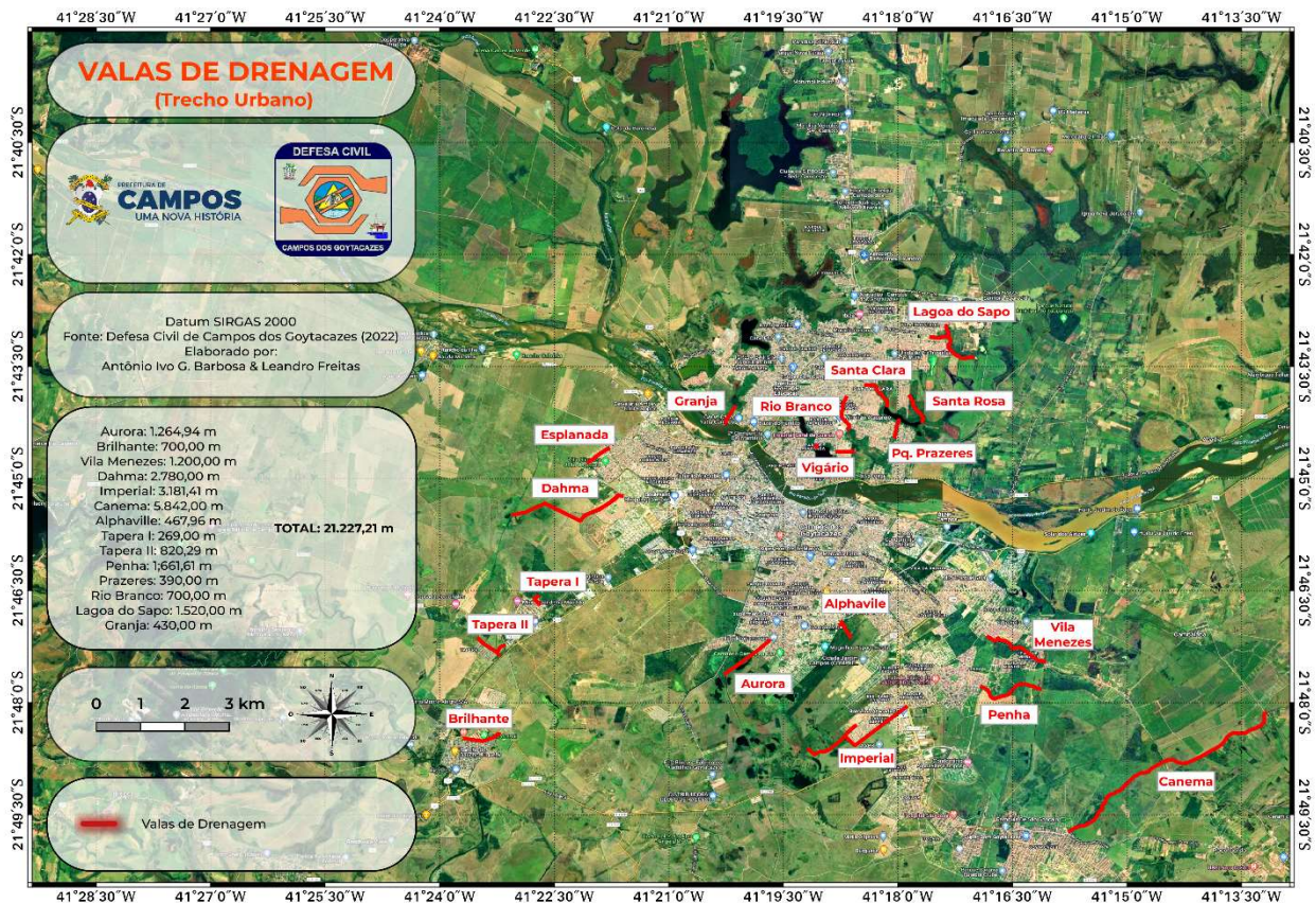
Figura 2 - Mapa de localização das valas de drenagem do trecho urbano do município de Campos dos Goytacazes.

Outra demanda reprimida da Defesa Civil, que exige a utilização dos equipamentos supracitados, é a demolição de imóveis – numa situação excepcional -, quando as famílias, após vistoria da Secretaria de Defesa Civil e com encaminhamento de laudos técnicos, precisam ser retiradas dos respectivos imóveis que oferecem risco estrutural e, por este motivo, expõem os municípios à situação de risco iminente.