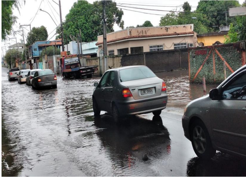
Figura 1 - Avenida Souza Mota