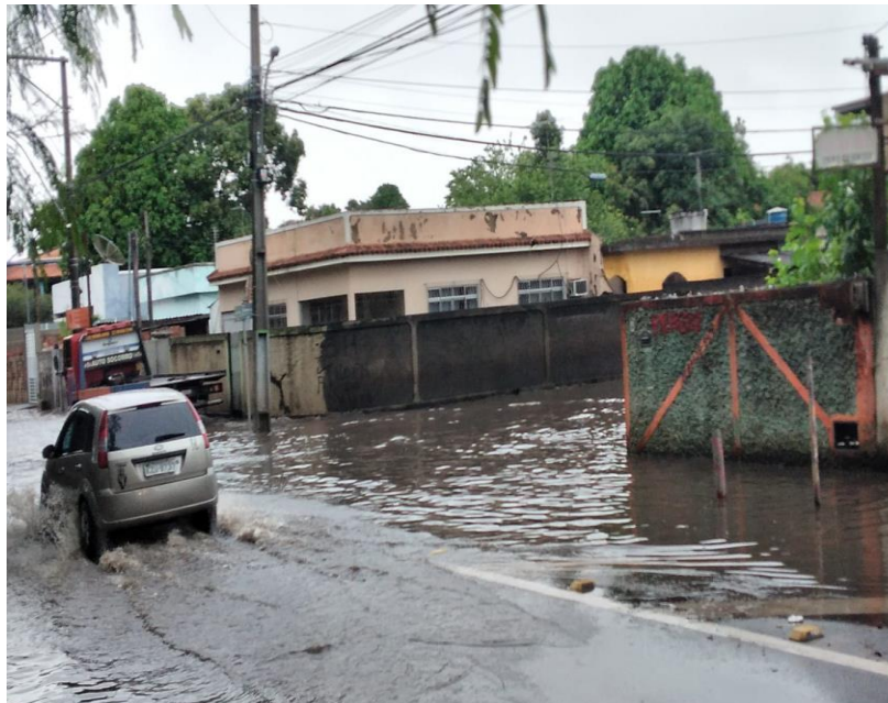
Figura 2 - Avenida Souza Mota