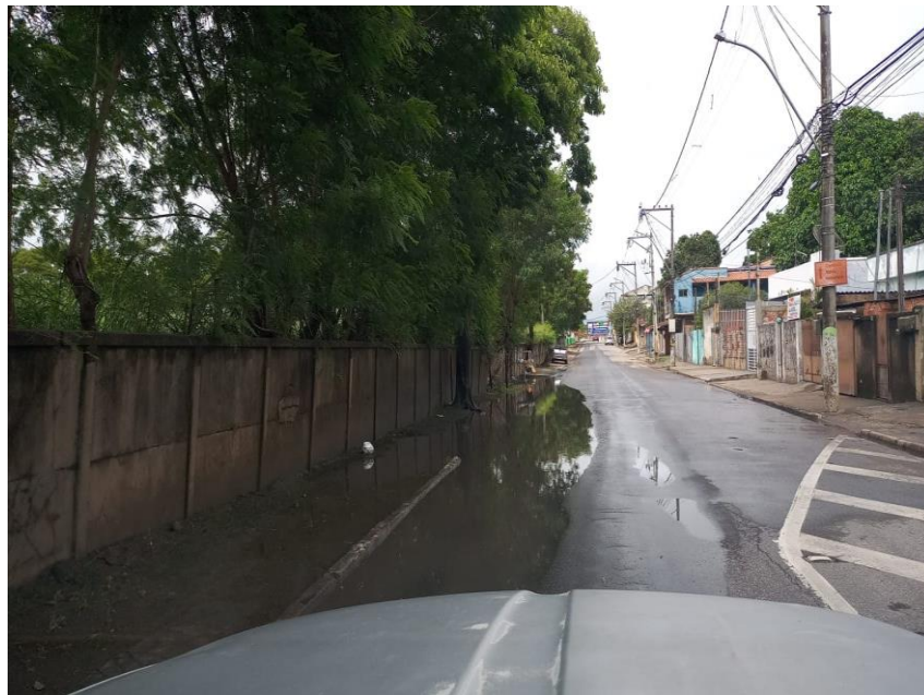
Figura 4 - Avenida Souza Mota