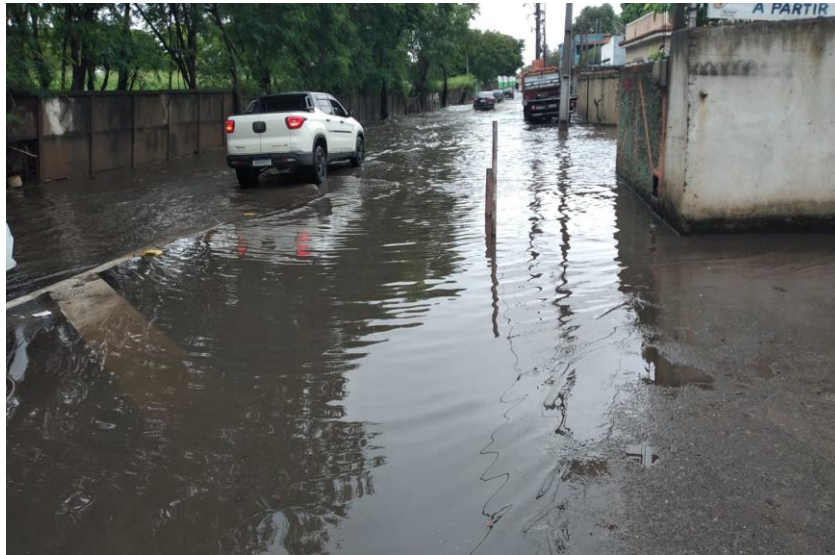
Figura 3 - Avenida Souza Mota